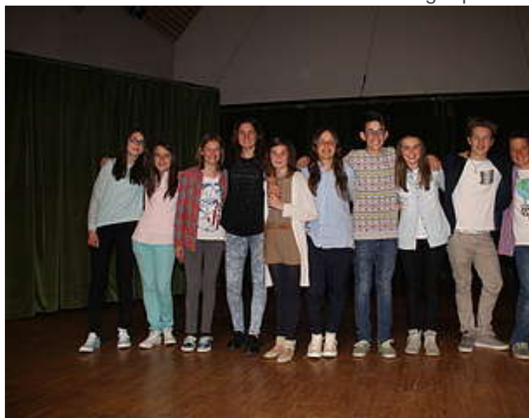
Ragazzi di 3 a media - progetto cortometraggio L'Alternativa