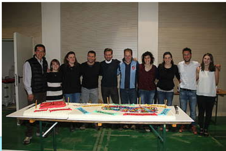
L'equipe educativa del CiAGì

Il Centro di Aggregazione Giovanile di Livigno Trepalle, "Ci.A.Gì. Centroanch'io", gestito dalla Cooperativa Sociale L'Impronta , ha festeggiato 25 anni di attività. Per celebrare questo importante anniversario della storia di una comunità, l'equipe educativa del CiAGì, con il patrocinio del Comune di Livigno e del BIM dello Spöl, ha organizzato due giorni di incontri e dialogo per famiglie, operatori e ragazzi con il titolo "Famiglie al Centro – una comunità che educa".