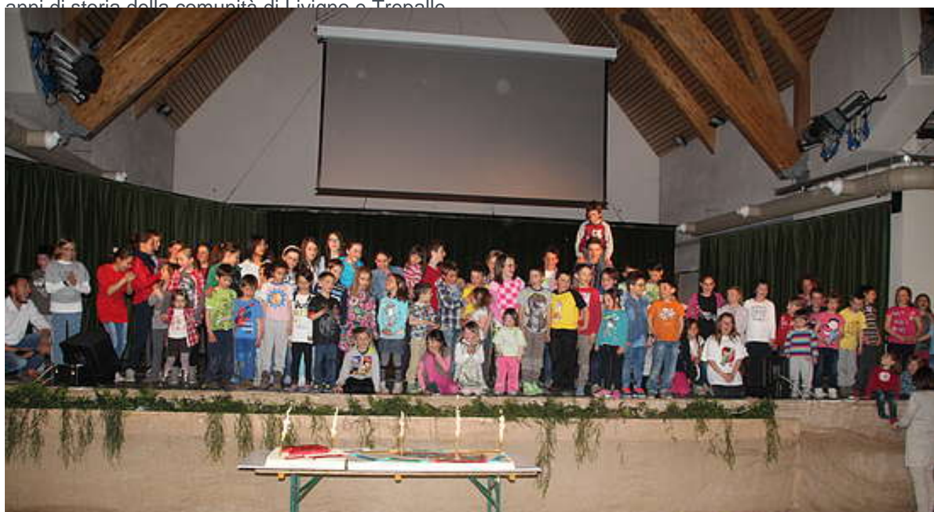
L'equipe E del Ci.A.Gì